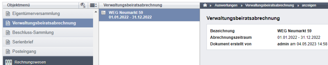
Abb. 356: Verwaltungsbeiratsabrechnung

(3) Klicken Sie die Checkbox für Abrechnungsbestandteile an, um diese zu markieren.